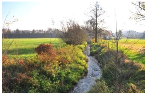
Cil wuwica za naše wodźizny: Na brjohach smědža štomy a kerki rosć. Hdžež skića štomy chćódk, móže so nałožena próca za wobstajnje syćenje redukować. Wotběh wody je při wšěm zaručeny. Kroma twori přechod k susodnemu wužiwanju.

W slědowacych linkach nańdžeće dalše informacije, kak móhło so wobhospodarjenje wodźiznow w gmejnje změnić a kajke móžnosće a potenciale so takle skića.