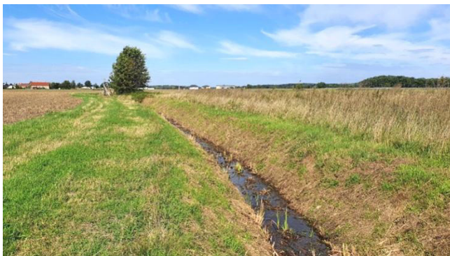
Typiska rěčka w gmejnje: Rěčka bu jako pravidlowny trapec wutwarjena, zrunana a je nimale bjez drjewiny. Zo by so staw wutwara zdžeržať, so brjohi a dno intensiwnje syku resp. wurjedža. Domoródnje zwěrjata a rostliny njenańdu nimale žadyn žiwjenski rum, zakonske předpisy so njedodžerža.

koncept za wobhospodarjenje wodźiznow w gmejnje nadžětať. W nim so naprawy ekologiske přiměrjeneho wobhospodarjenja wodźiznow předstaja, kotrež móža rěčki na teritoriju našeje gmejnje zaso žiwjenahódne a dožiwjenja poľne sćinić (hlej wobrazy). Z tym so wjacekróćny wužitk docpěje: Z mjenje džětom so košty lutuja. Hdžež je trjeba, wostanje wotliw zaručeny. Hdžež je móžno, ma so hódnota wodźiznow ekologiske powyšić, zo bychu jako žiwjenski rum zaso domoródnym rostlinam a zwěrjatom k dispoziciji stali a so zakonske směrnicy spjelnili. Hladajo na přiběrace ekstremne wjedrowe situacije maja wodźizny při wysokej a niskej wodže fungować. Runočasnje ma so hódnota wočerstwjenja powyšić. Wšitke naprawy hodža so najlěpje w dorozumjenju z potrjechenymi wužiwarjemi, wobsedzerjemi a wotnajerjemi přewjesć. Při tym maja so kompromisy nać, zo njebychu naprawy k hladanju a wuwicu běžatych wodźiznow jenož zakonske předpisy spjelnili, ale tež wysoku akceptancu pola ludnosće a potrjechenych docpěli.